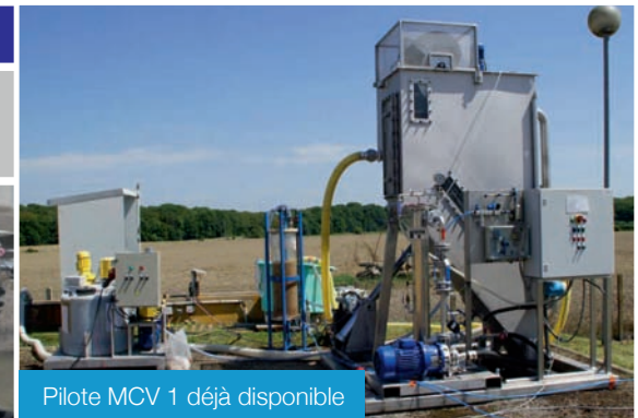
Pilote MCV 1 déjà disponible